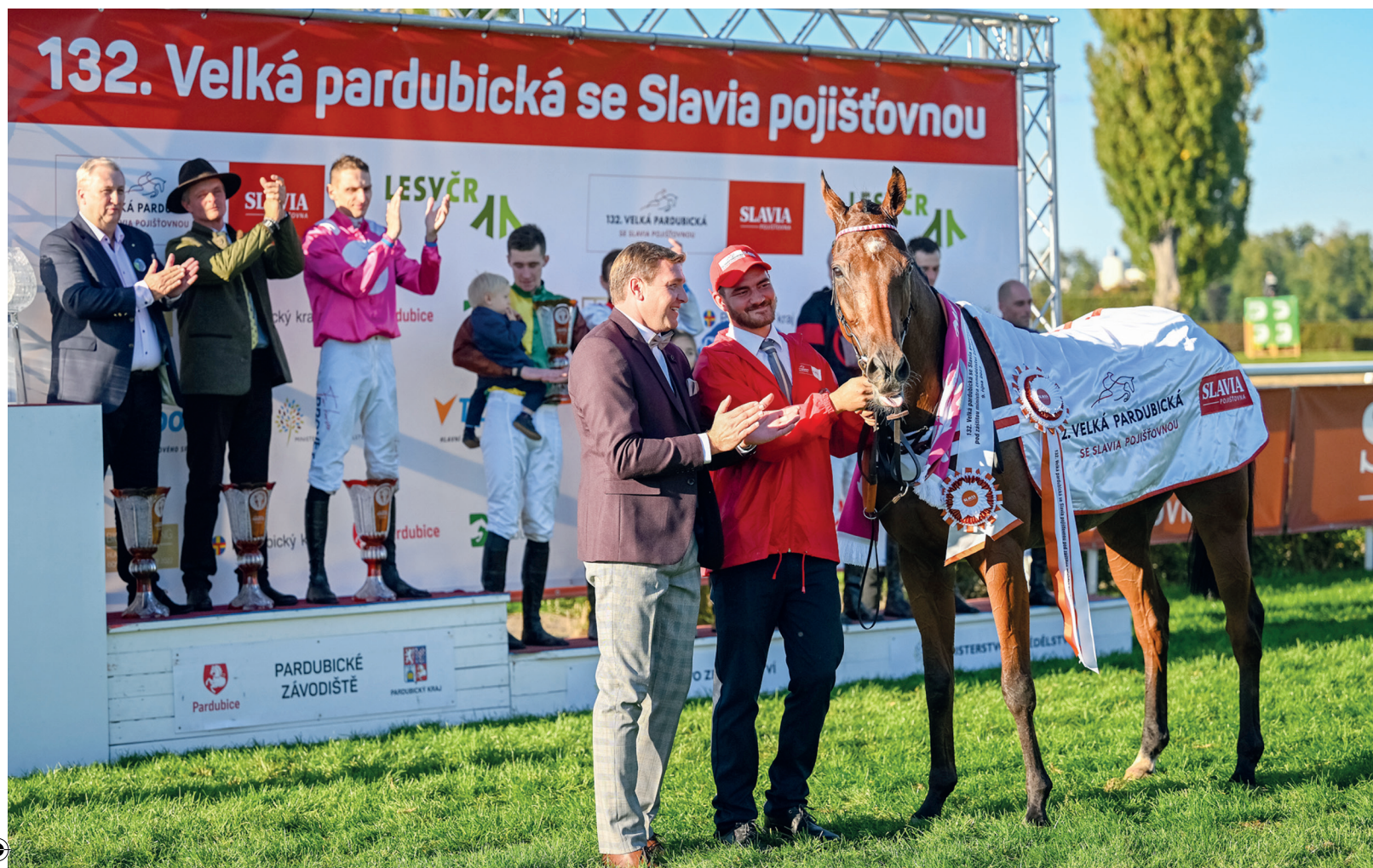
Vítěz Velké pardubické 2022 Mr Spex, v pozadí mu tleskají jeho majitel, trenér a žokej.