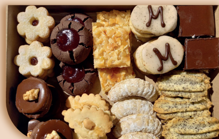
♥ Vánoční prababiččina cukroví