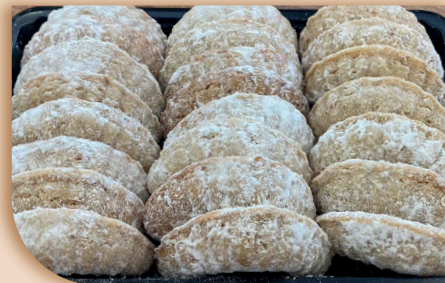
♥ Linecká kvítečka máslová