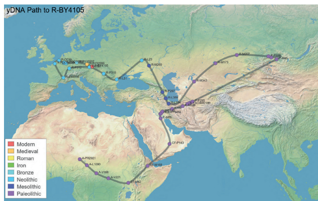
Model migrace mých předků v paternální linii od nejstarších dob až současnosti