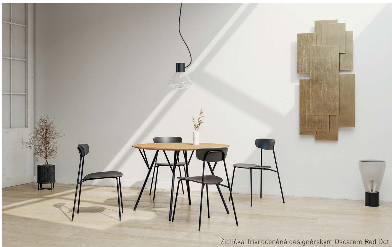
Židlička Trivi oceněná designérským Oscarem Red Dot

zdařila. Už nyní s ním pracujeme na křesílku v podobném duchu, jako je Trivi, ale v relaxační podobě.