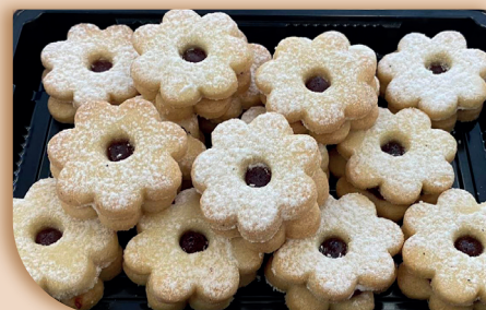
♥ Matějovy rohlíčky máslové

Zborovická 1193/10, 678 01 Blansko Tel.: 516 417 503-4, E-mail: info@matejovopekarstvi.cz www.matejovopekarstvi.cz