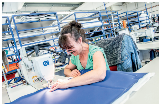
Švadlena na šicí dílně

Kromě stabilní práce a fajnového kolektivu také řadu různých výhod. Máme ve firmě dvě posilovny, jednu pro ženy a jednu pro muže. Také máme vlastní fyzioterapeutické a masážní studio. Některé práce u nás jsou fyzicky docela náročné, takže o masáže je opravdu vysoký zájem.