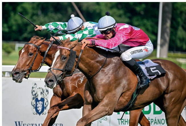
Darling in Pink mířící za jedním ze svých letošních bratislavských vítězství.

zvítězila v Mostě v Ceně zimní královny, což je největší dostih pro dvouleté klisny, navíc RALPH byl druhý v Ceně zimního favorita. Oba jsou to čeští odchovaní, což je nejlepší možná odpověď některým „škarohlídům“, kteří tvrdí, že se soustředíme jen na zahraniční nákupy. Oba jsou odchovaní z hřebčína v Napajedlech, dokážou porazit i francouzské, irské nebo anglické koně a jsou velkým příslibem do budoucna. Na koho bych nerad zapomenul, je DEVIL IN PINK, který zvítězil s náskokem devíti délek v dostihu první kategorie pro dvouleté koně v Karlových Varech v Ceně Masise, navíc byl pátý ve Francii v prestižním dostihu.