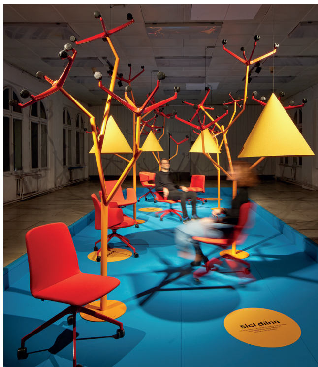
LD Seating na Designbloku, festivalu designu v Praze