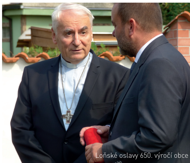
Loňské oslavy 650. výročí obce