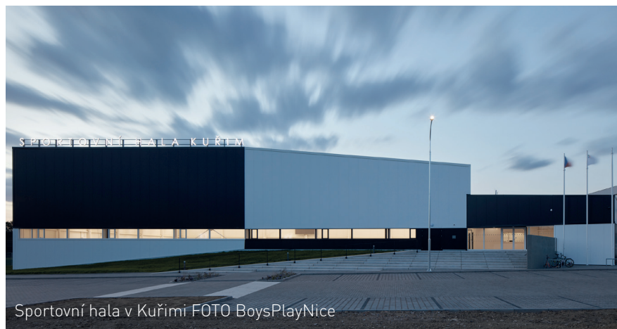
Sportovní hala v Kuřimi