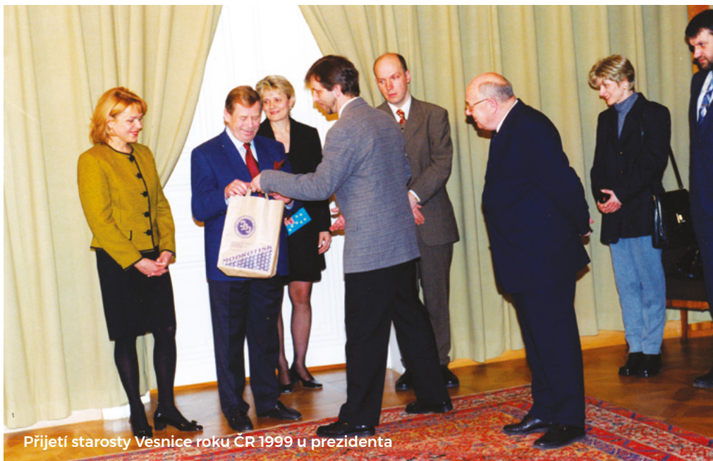
Přijetí starosty Vesnice roku ČR 1999 u prezidenta