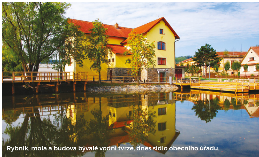
Rybniček, mola a budova bývalé vodní tvrze, dnes sídlo obecního úřadu.

Kromě plánů stavebních by měla podle mého názoru žít obec bohatým kulturním a společenským životem. Z novinek bych