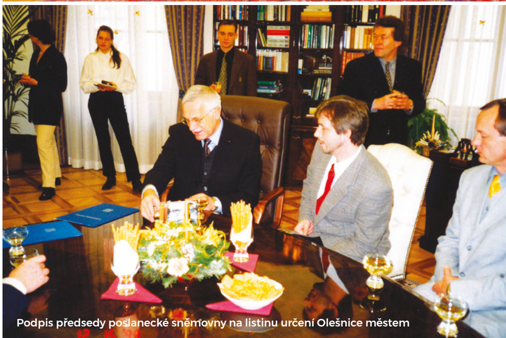
Podpis předsedy poslanecké sněmovny na listinu určení Olešnice městem