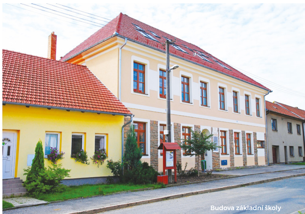
Budova základní školy