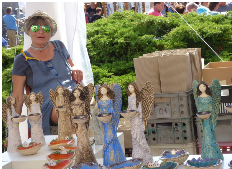
MĚSTO KUNŠTÁT, NÁMĚSTÍ KRÁLE JIŘÍHO