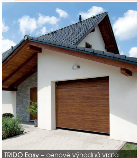
TRIDO Easy – cenově výhodná vrata