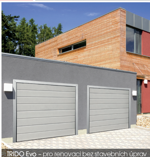
TRIDO Evo – pro renovaci bez stavebních úprav