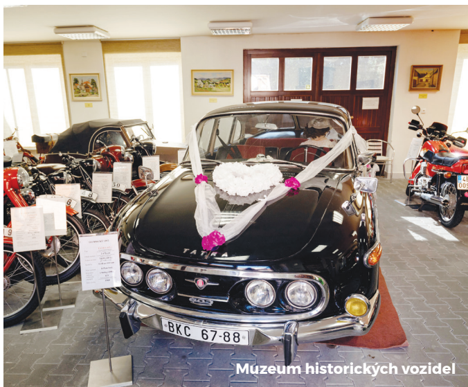
Muzeum historických vozidel