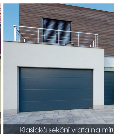
Klasická sekční vrata na míru