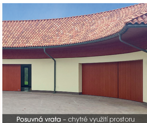
Posuvná vrata – chytré využití prostoru