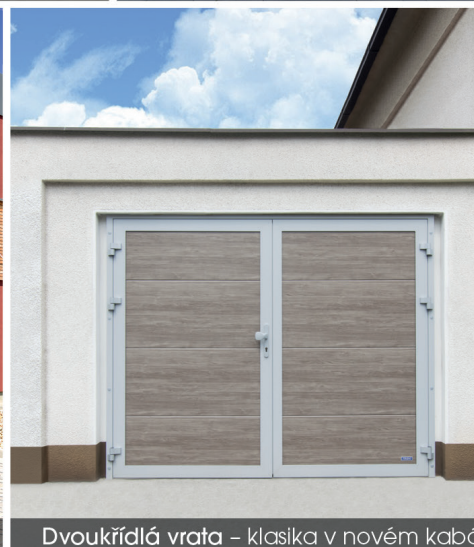
Dvoukřídlá vrata – klasika v novém kabátě