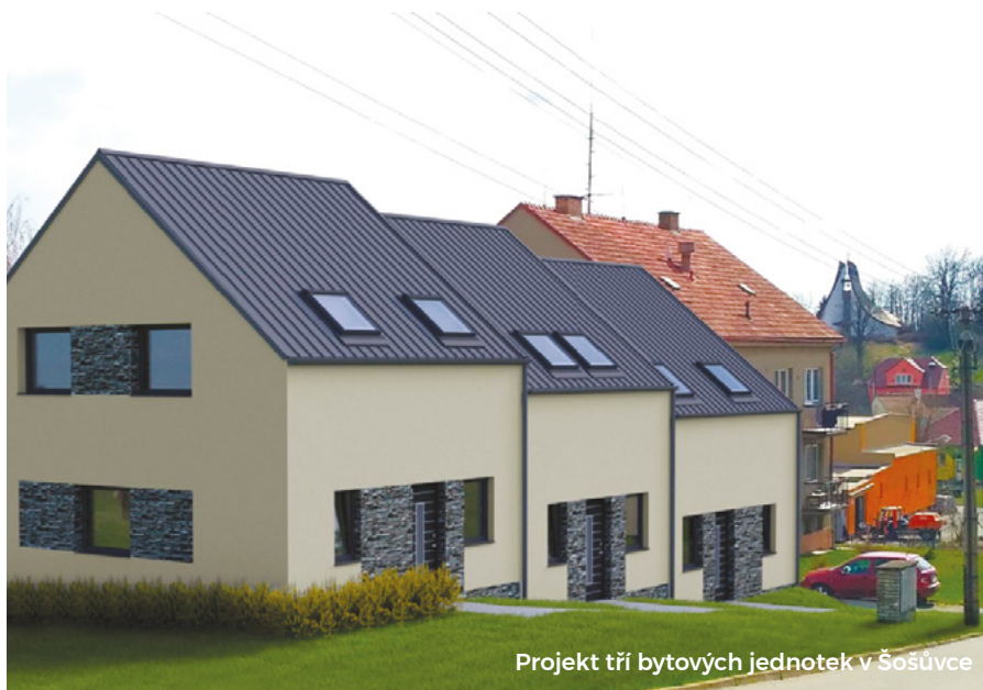
Projekt tří bytových jednotek v Šošůvce