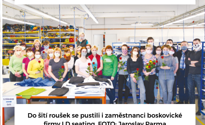
Do šití roušek se pustili i zaměstnanci boskovické firmy LD seating.