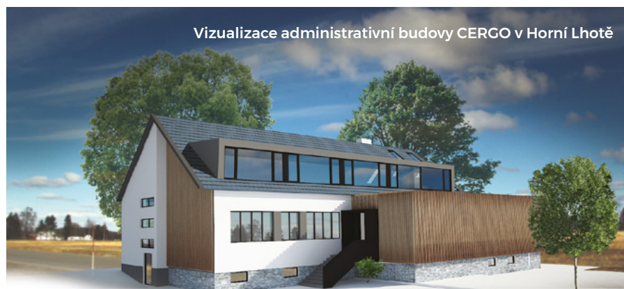
Vizualizace administrativní budovy CERGO v Horní Lhotě