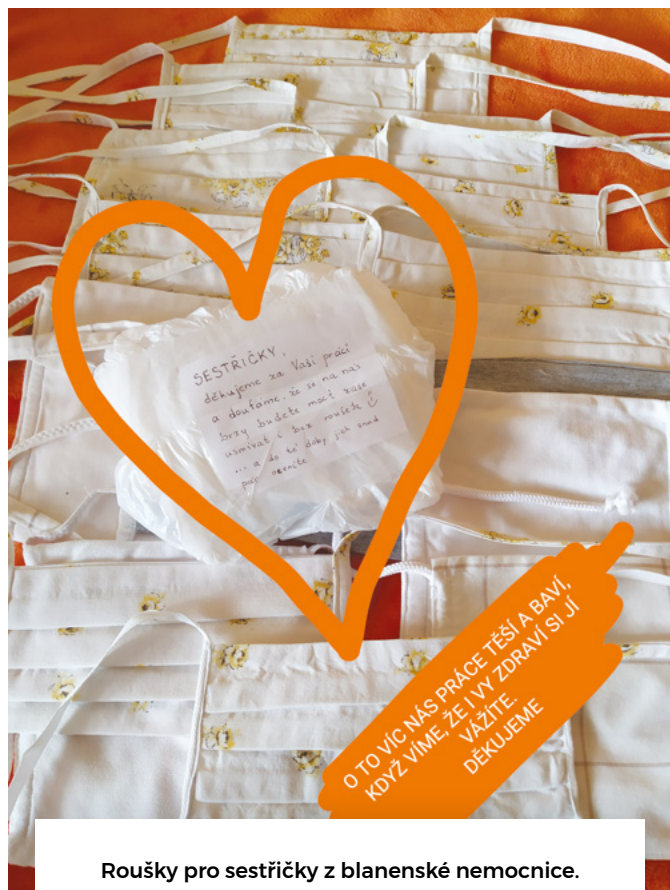
Roušky pro sestřičky z blanenské nemocnice.