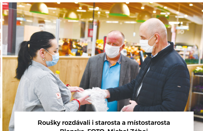
Roušky rozdávali i starosta a místostarosta Blanska.