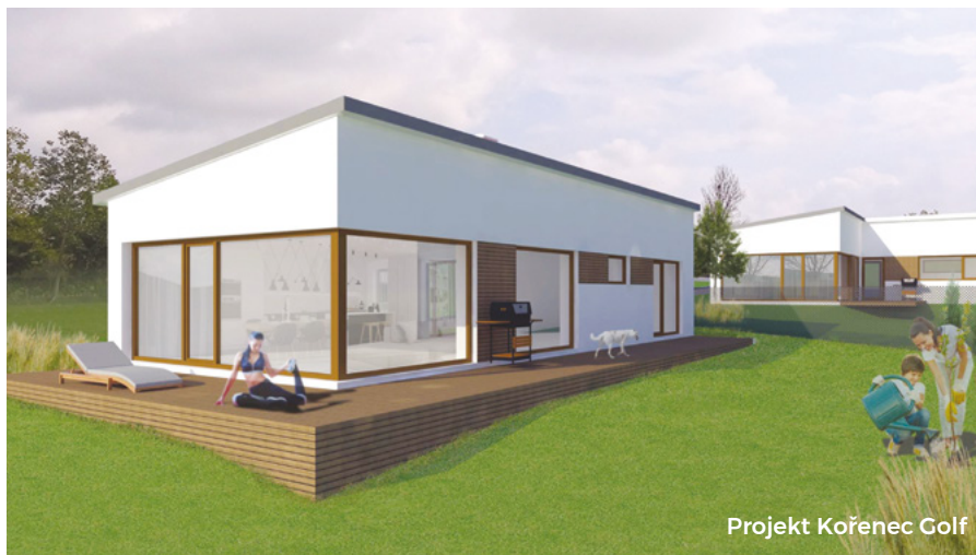
Projekt Kořenec Golf