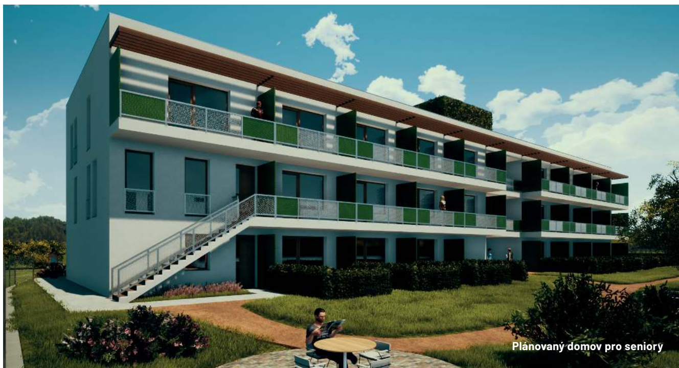
Plánovaný domov pro seniory